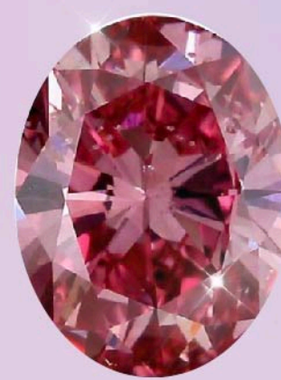
Fancy vivid pink