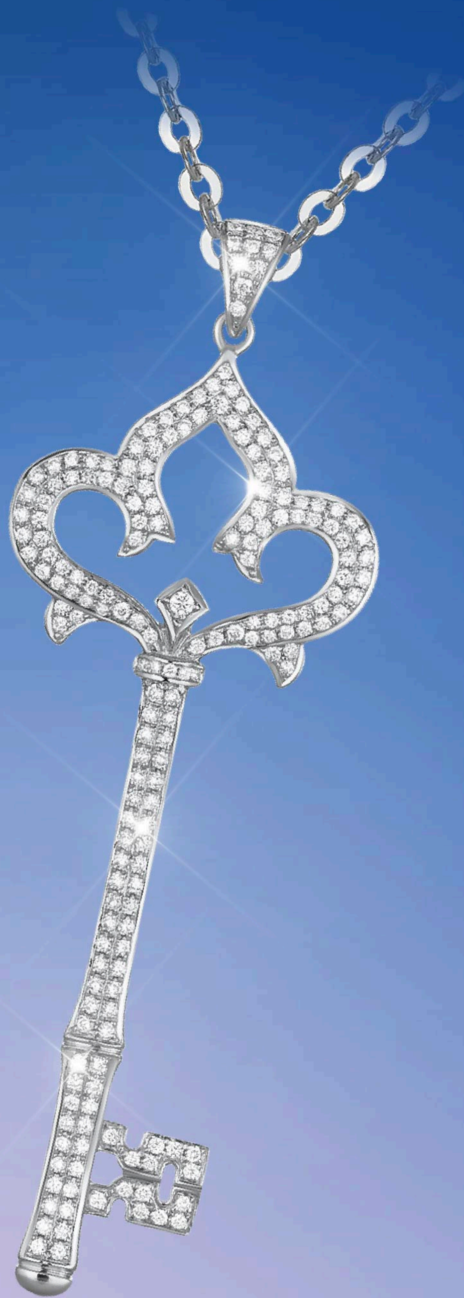
LILY PENDANT DPC3723R01M