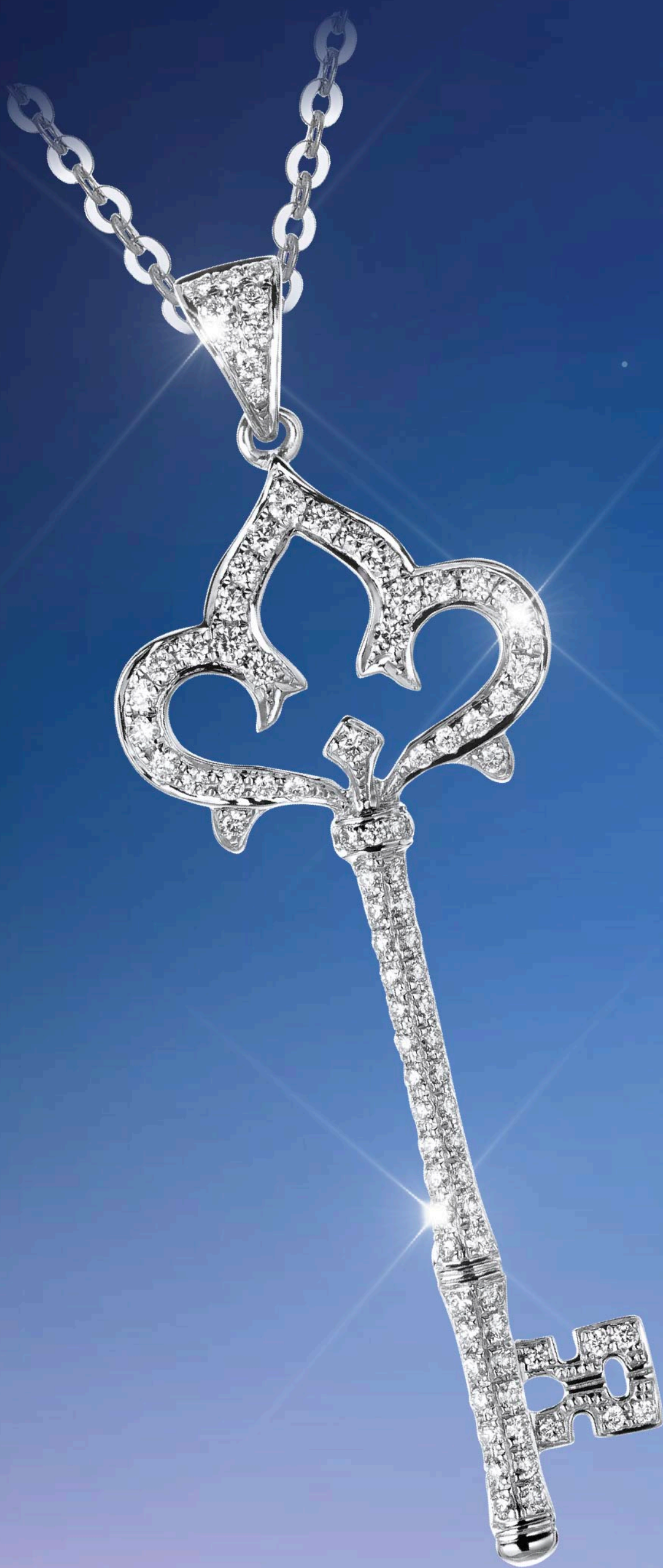
LILIAN PENDANT DPC3723S01M