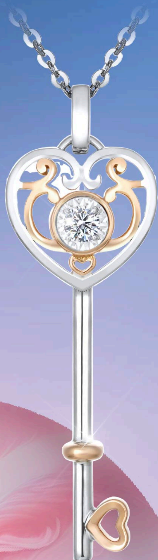
KEY HEART ADP1909010CS