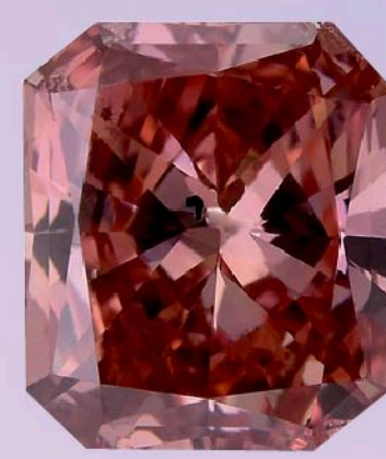
Fancy deep pink

Adelle memilih light pink diamond untuk melengkapi koleksi Mon Chérie.