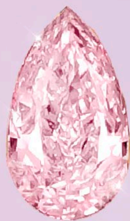
Fancy intense pink